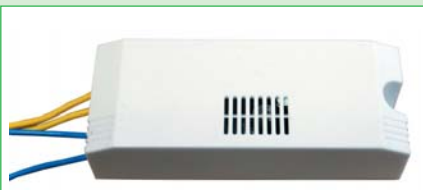
Оптико-акустический датчик «СЗВО.4.К»