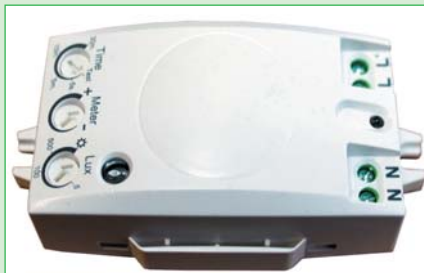
Оптический датчик движения HD-610M